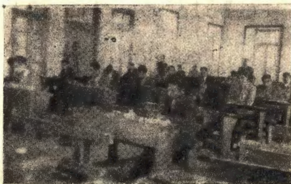
« دانش آموزان سال ششم در صحنه امتحانات »

شورای فرهنگ اکنون سال دوم خود را می پیماید و آئین نامه شوری مشتمل بر ۱۴ ماده و یک تبصره است که در چهارصد و سی امین