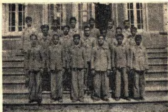
« دانش آموزان سال چهارم دبیرستان »

همچنین از طرف همه فارغ التحصیل ها و کارمندان انجمن از رئیس محبوب و کاردان دبیرستان آقای گرامی تشکر می کنیم که در هیچ مورد