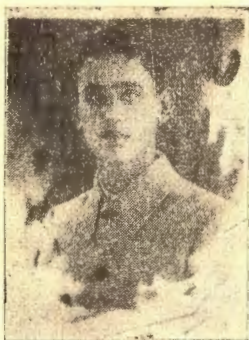
« آقای رهبر روشندل شاگرد اول » « سال سوم دیرستان »

در اوایل جلسات سخنرانی نخبه ای از دانش آموزان با ذوق که در فن تئاتر سر آمد اقران بودند صحنه دیرستان را اداره میکردند ولی برای آنکه همه اوقات آن عده در این راه تباه نشود و از امر مطالعه و کار