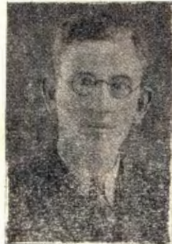
« آقای ازگمی »