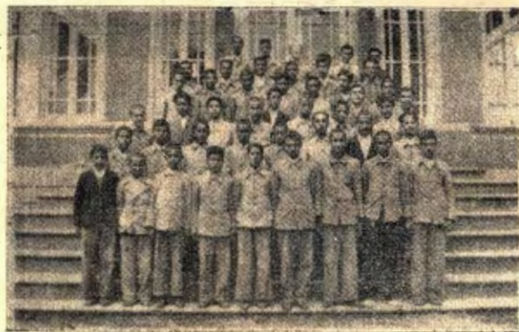
« دانش آموزان سال سوم دبیرستان »

شورای فرهنگ این شهرستان باستناد قانون تأسیس شعب شورای عالی فرهنگ در مرکز استانها و شهرستانها که در تاریخ ۱۴ شهریور ۱۳۰۶