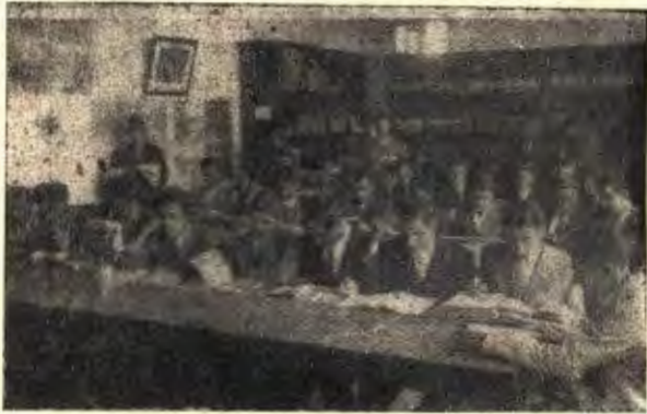
« تالار کتابخانه دبیرستان شاهپور رت »