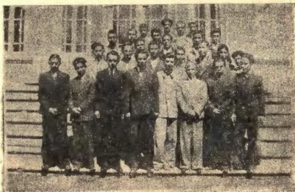
« دانش آموزان سال ششم طبیعی »