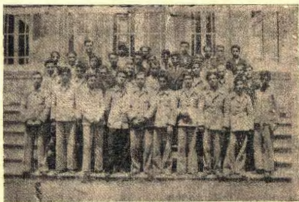
« دانش آموزان سال پنجم دبیرستان »

« پیش از آنکه گزارش کارهای اجتماعی را بعرض برسانم از آقایان اجازه میخواهم که بیک اصل مهمتری بپردازم. اینجانب امشب بعهده گرفته ام که ترجمان احساسات بیش از صد نفر از فارغ التحصیلان این دبیرستان باشم بمناسبت پایان تحصیلی از آقایان دبیران و مربیان محترم که در طی سالیان دراز در تربیت استعداد و در زندگی فکر و تلطف ذوق با زحمات فراوان متحمل شده اند سپاسگزاری نمایم، ضیق وقت و محدودیت دایره الفاظ مجالی برای بیان معانی و احساسات نخواهد گذاشت که ماهمه آنچه که در دل داریم بر زبان آوریم، همگان میدانیم که استعداد